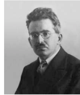
Walter Benjamin 2