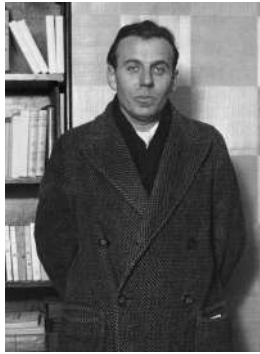
Louis Ferdinand. Céline 2