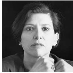
Rosalind Krauss 2